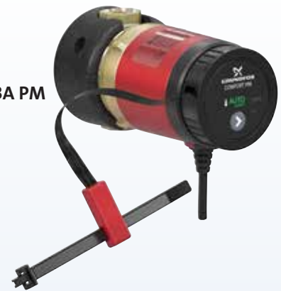
COMFORT BA PM AUTOADAPT