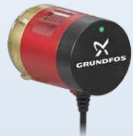
COMFORT MB PM AUSTAUSCHKOPF