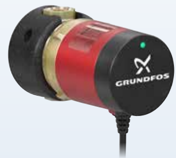
COMFORT B PM 1-STUFIG