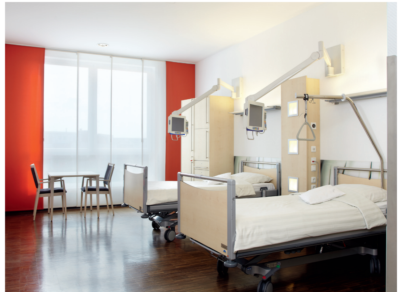
Positiver Gesamteindruck bei der Zimmerausstattung

In den neu gestalteten Patientenzimmern herrscht ein besonderes Wohlfühlambiente. Durch den Einsatz von Naturmaterialien wie Echtholzparkett sowie einer exklusiven Zimmerausstattung in hellen und freundlichen Farben wird der positive Gesamteindruck noch verstärkt. Zurzeit wird das St. Vinzenz-Hospital um einen Neubau mit insgesamt 56 Betten erweitert. Dort steht dann nach Erweiterung den neuen Stationen zusätzlich eine großzügige, lichtdurchflutete Patientenlounge zur Verfügung.