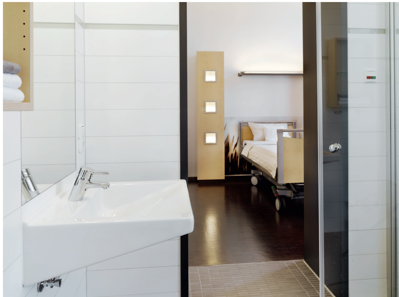
S50 Waschtisch für barrierefreie Anwendungen