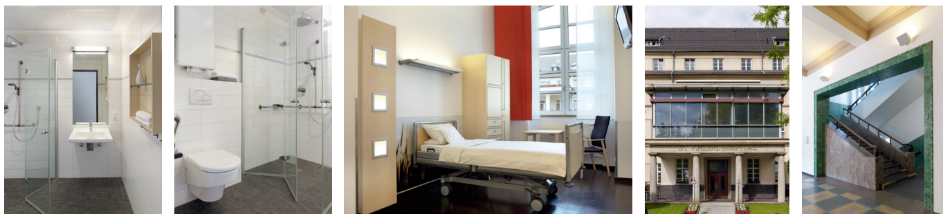
Blick in den Innenhof