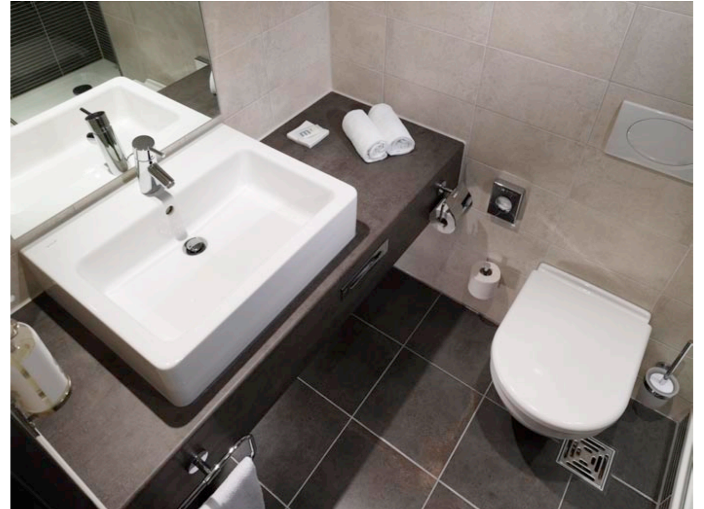
Nuovella Waschtisch 60 cm mit S50 Wand-WC und WC-Sitz