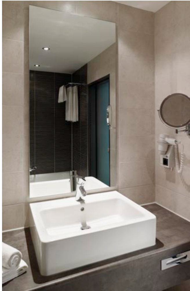
Nuovella Waschtisch 60 cm