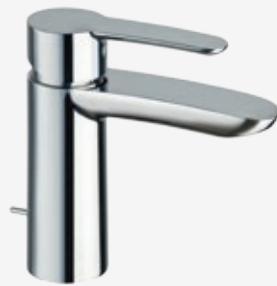
Einhebel-Waschtischarmatur mit Zugstangen-Ablaufgarnitur 1 ¼" und flexiblen Anschlussschläuchen, Höhe 15,5 cm, Ausladung 11 cm