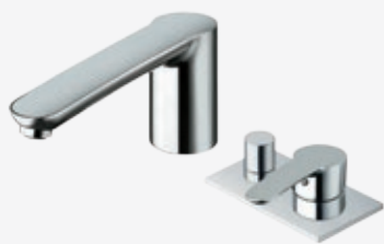
Wannenrand-Einhebelmischer mit Umsteller und Wanneneinlauf Ausladung 19 cm