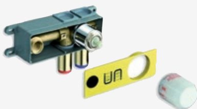
Universal Unterputz-Einbaukörper für Wand-Waschtischarmatur, mit Eco-Kartusche C35, aus entzinkungsfreiem Messing