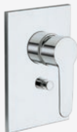
Fertigmontageset Einhebel-Wannenarmatur* Bausatz für Wandeinbau, inklusive Kartusche, mit Rosette aus Metall 19 x 13 cm