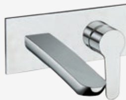
Fertigmontageset Wand-Einhebel-Waschtischarmatur* Ausladung 18,5 cm, Abdeckplatte: 9 x 21 cm, Montage mit Universal UP-Einbaukörper