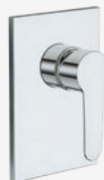
Fertigmontageset Einhebel-Brausearmatur* Bausatz für Wandeinbau, inklusive Kartusche, mit Rosette aus Metall 19 x 13 cm