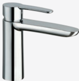
Einhebel-Waschtischarmatur Comfort ohne Zugstangen-Ablaufgarnitur, mit flexiblen Anschlussschläuchen, Höhe 17 cm, Ausladung 14 cm