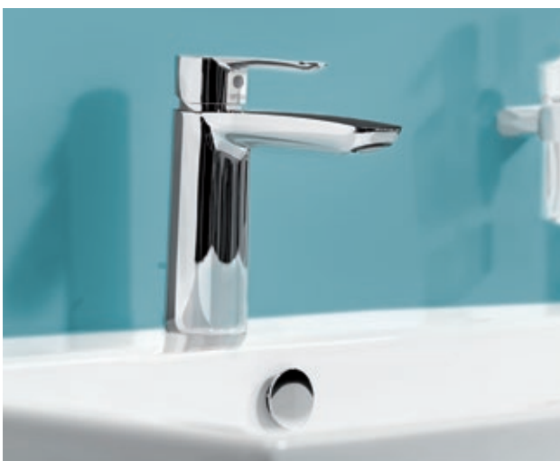
Ästhetische Erscheinung: Waschtisch-Einhebelmischer