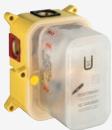
Universal Unterputz-Einbaukörper für Fertigmontageset Wannen-/ Brausearmatur mit Rückflussverhinderer und Rohrunterbrecher, Kartusche wird mit Farbset geliefert