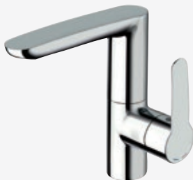
Einhebel-Waschtischarmatur mit seitlicher Bedienung schwenkbar, ohne Ablaufgarnitur, mit flexiblen Anschlussschläuchen, Höhe 19 cm, Ausladung 14 cm