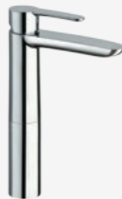
Einhebel-Waschtischarmatur ohne Zugstangen-Ablaufgarnitur, mit flexiblen Anschlussschläuchen, Höhe 28 cm, Ausladung 14 cm