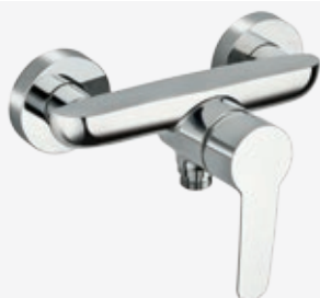
Einhebel-Brausearmatur Ausladung 5,2 cm (Wand bis Mitte Auslauf)