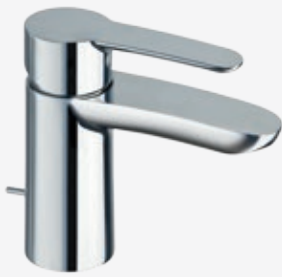
Einhebel-Waschtischarmatur für Handwaschbecken mit Zugstangen-Ablaufgarnitur 1 ¼" und flexiblen Anschlussschläuchen, Höhe 13,5 cm, Ausladung 10 cm