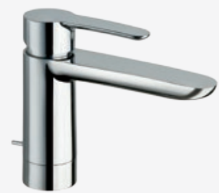
Einhebel-Waschtischarmatur mit schwenkbarem Auslauf und Zugstangen-Ablaufgarnitur 1 ¼", Höhe 16 cm, Ausladung 14 cm