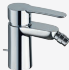
Einhebel-Bidetarmatur mit Zugstangen-Ablaufgarnitur 1 ¼" und flexiblen Anschlussschläuchen, Höhe 12,5 cm, Ausladung 10 cm