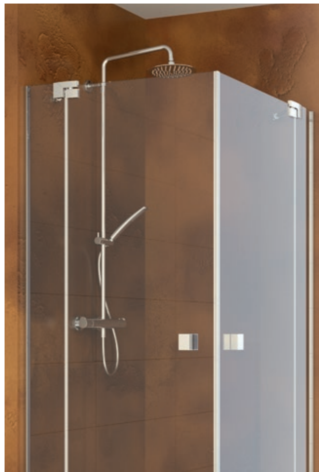
Topdesign für die Wand: Duschsystem bestehend aus Thermostat-Brausebatterie mit Kopf- und Handbrause