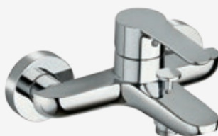
Einhebel-Badarmatur mit Rückflussverhinderer Ausladung 15,8 cm (Wand bis Mitte Perlator)