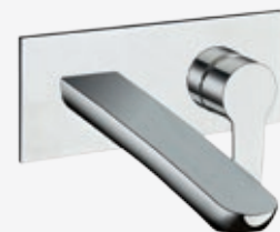
Fertigmontageset Wand-Waschtisch-Einhebelarmatur* Ausladung 23 cm, Abdeckplatte: 9 x 21 cm, Montage mit Universal UP-Einbaukörper