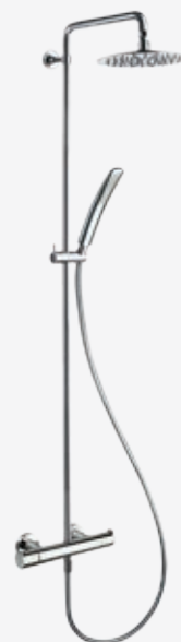
Duschsystem bestehend aus Thermostat-Brausebatterie (Aufputz) mit Kopf- und Handbrause Armaturenkörper mit Verbrühungsschutz, mit schwenkbarem Rohr und Sandwichkopfbrause Ø 20,5 cm, Handbrause mit Antikalk-System und Brauseschlauch "Longlife" mit verstellbarem Brausehalter