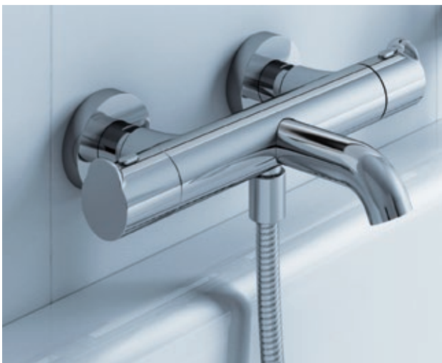
Wanneneinlauf modern interpretiert: Wannen-Thermostat-Aufputz

Die zuverlässige Technik im Inneren der Optima X Einhebelmischer und Thermostate garantiert langanhaltende Freude im täglichen Umgang.