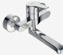
Waschtisch-Einhebelmischer Wandmontage, Ausladung 208 mm, mit schwenkbarem Gussauslauf