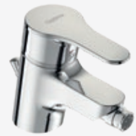
Bidet-Einhebelmischer Ausladung 110 mm, mit Kugelgelenkperlator und Ablaufgarnitur