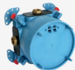
Universal Unterputz-Bausatz für Misch- und Thermostataraturen