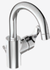
Waschtisch-Einhebelmischer mit hohem Auslauf, Ausladung 146 mm, Auslaufhöhe 151 mm, mit Ablaufgarnitur, mit schwenkbarem Rohrauslauf und Luftsprudler