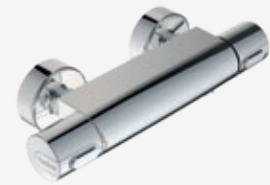
Brause-Thermostat Aufputz Temperatureinstellung und -begrenzung (Kindersicherung), eigensicher gem. DVGW