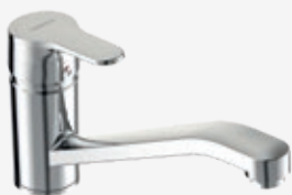
Spültisch-Einhebelmischer Ausladung 233 mm, Auslaufhöhe 120 mm, Montage mit flexiblen Schläuchen