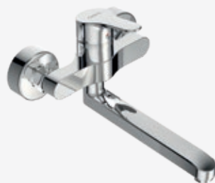
Spültisch-Einhebelmischer mit schwenkbarem Gussauslauf, Ausladung 258 mm