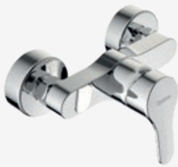
Brause-Einhebelmischer eigensicher gem. DVGW, Brauseabgang nach unten