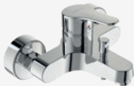
Wannen-Einhebelmischer Ausladung 159 mm, mit automatischer Umschaltung von Brause auf Wanne