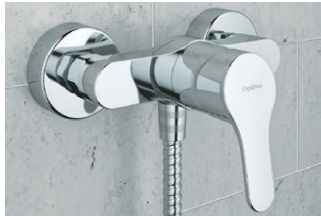
Optima S Brause-Einhebelmischer in der Aufputz-Version

Informationen über weitere Artikel wie Optima Brausen, Keramik oder Accessoires, die alle genau auf das Optima S Armaturen-Programm abgestimmt sind, finden Sie in ergänzenden Informationsunterlagen.