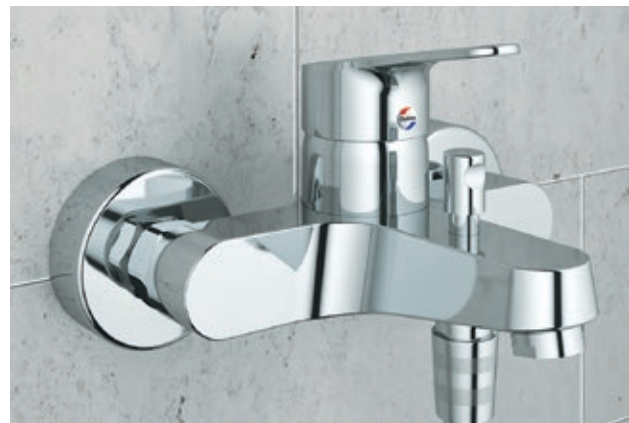
Optima S Wannen-Einhebelmischer mit Umstellung für die Brause und automatischer Rückstellung auf die Wanne