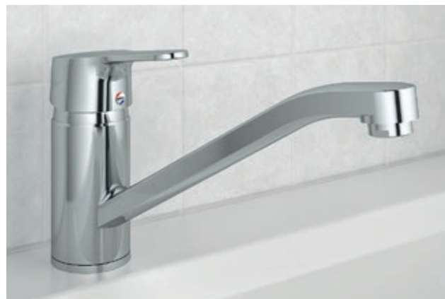
Optima S Spültisch-Einhebelmischer – die formschöne Ergänzung für die Küche