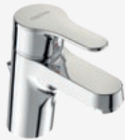
Waschtisch-Einhebelmischer Ausladung 106 mm, mit Ablaufgarnitur