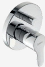
Fertigmontageset für Unterputz-Wannen-Einhebelmischer, automatische Rückstellung Wanne/ Brause