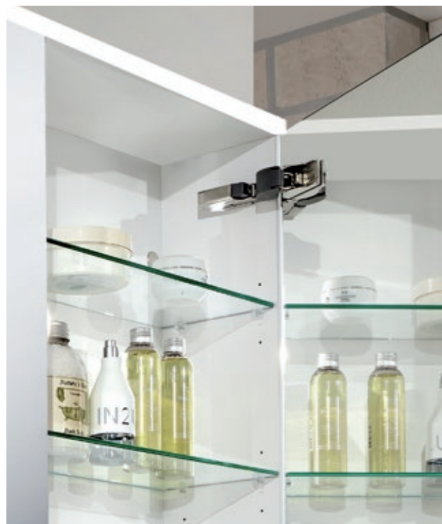
Optima X Spiegelschrank mit hochwertigen Beschlägen und Dämpfungssystem für sanftes, leises Schließen der Spiegeltüren