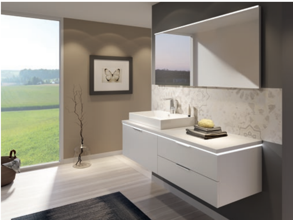
Optima X-Konsolenplatte Crystal

in der Farbe Weiß Matt mit Möbeln in Weiß Matt