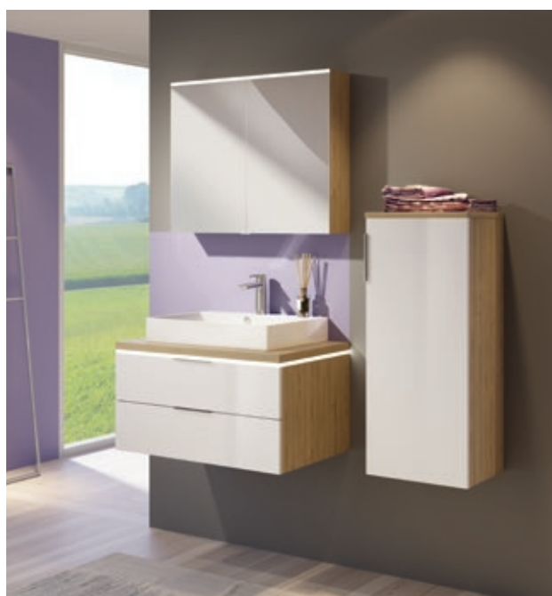
Optima X-Konsolenplatte Lite in der Farbe Ocean Pine mit Möbeln in Lack Weiß Glänzend