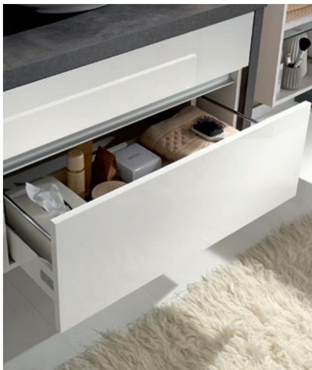
Optima X Waschtischunterschrank mit im Korpus integrierter Aluminium-Griffleiste G 988