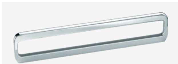
Optima X Griff Länge 16 cm (G 738), Länge 32 cm (G 739)

Komplettiert wird die attraktive Schrankauswahl durch die Festlegung der gewünschten Griffausführung. Bei dem Optima X Griffsortiment stehen entsprechende Optionen preisgleich zur Wahl.