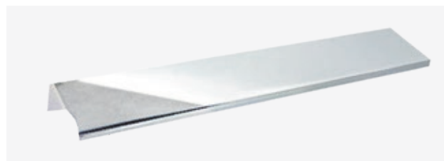
Optima X Griff Länge 18 cm (G 340)