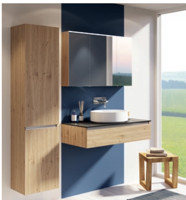
Optima X-Konsolenplatte Porzellankeramik in der Farbe Basalt mit Möbeln in Ocean Pine